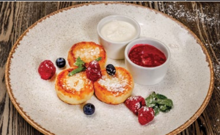
Сырники со сметаной 150/100 г 429 и клубничным соусом