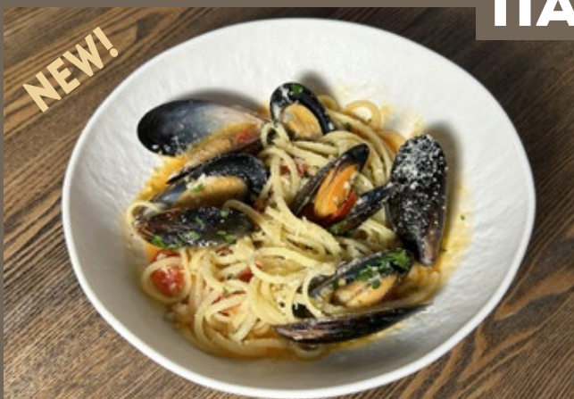
Лингвини, мидии, 380 гр 590 помидоры черри, Пармезан