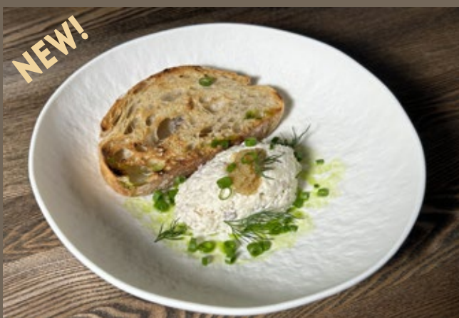
Намазка из трески, 150 гр 529 щучья икра, хрустящая чиабатта