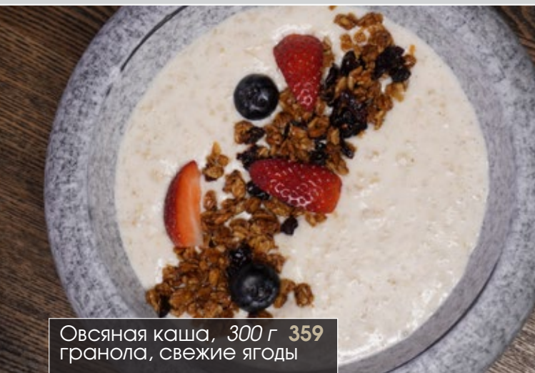
Овсяная каша, 300 г 359 гранола, свежие ягоды