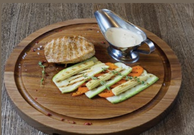
Стейк из филе 150/150/50 гр 729 индейки, овощи-гриль, соус из белых грибов