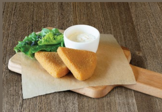
Жареный Сулугуни 100/50 гр 499 с соусом Тар-тар