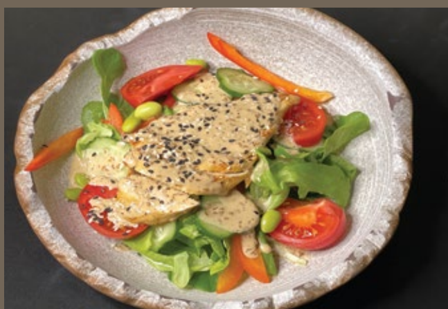
Куриная грудка, авокадо, 260 гр 559 бобы Эдамаме, свежие овощи, ореховая заправка