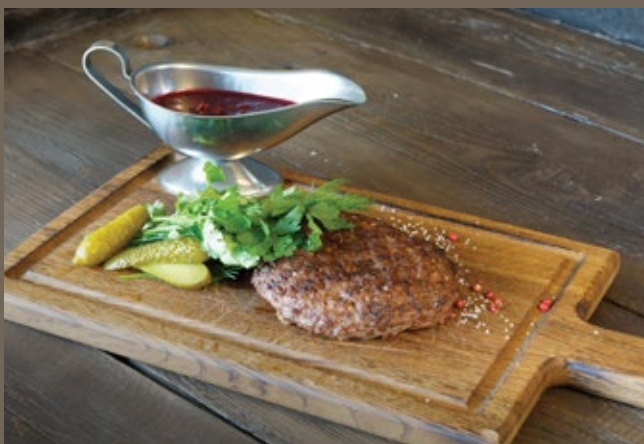
Котлета из мраморной 200/50 гр 829 говядины, брусничный соус