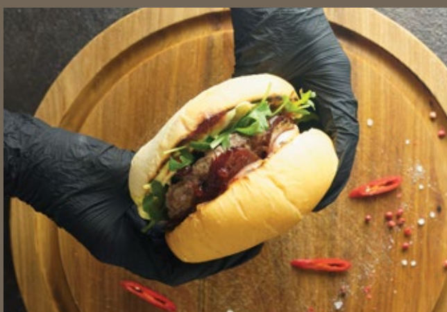
Бургер с котлетой 500 гр 790 из мраморной говядины с сыром Моцарелла