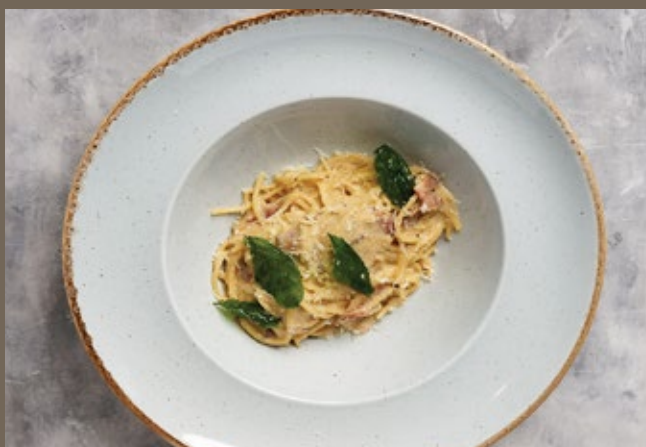
Спагетти карбонара 270 гр 559