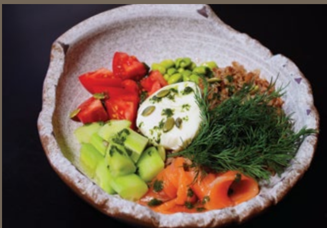
Греча боул с сёмгой, 330 гр 539 свежими овощами и яйцом пашот