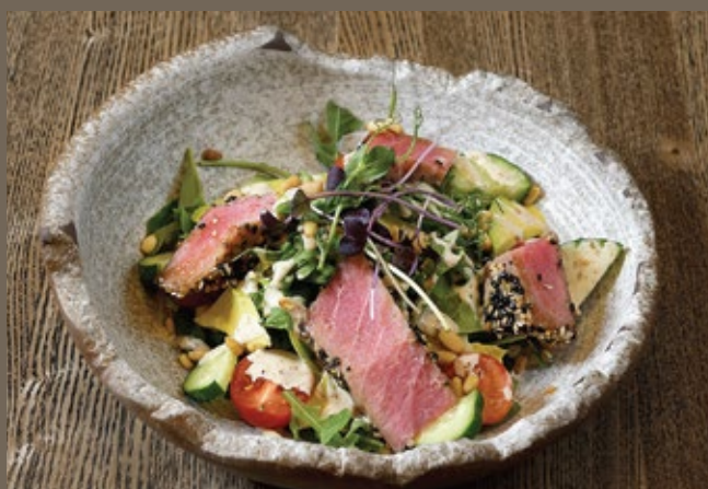
Тунец в кунжуте, авокадо, 230 гр 790 микс салата, ореховый соус