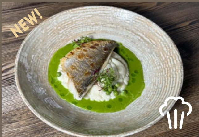
Филе дорадо, пюре из цветной 240 гр 759 капусты, шпинатный соус