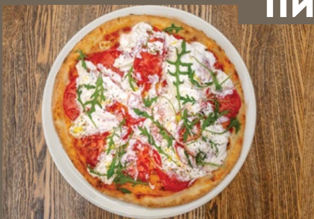
Страчателла, сладкие 450 гр 890 помидоры Черри, соус Песто