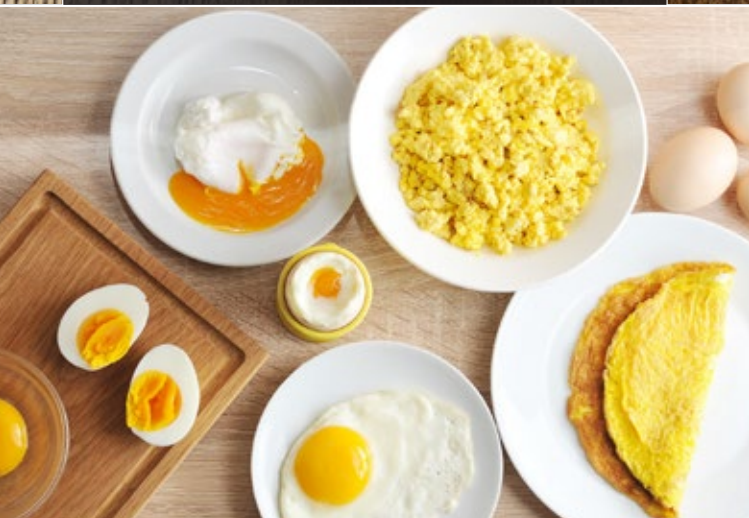
Яичница / Омлет 2 шт. 299 Скрэмбл / Яйца пашот