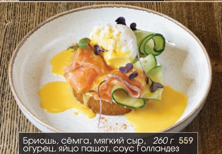
Бриошь, сёмга, мягкий сыр, 260 г 559 огурец, яйцо пашот, соус Голландез