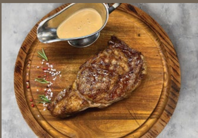
Рибай за 100 гр 1 190