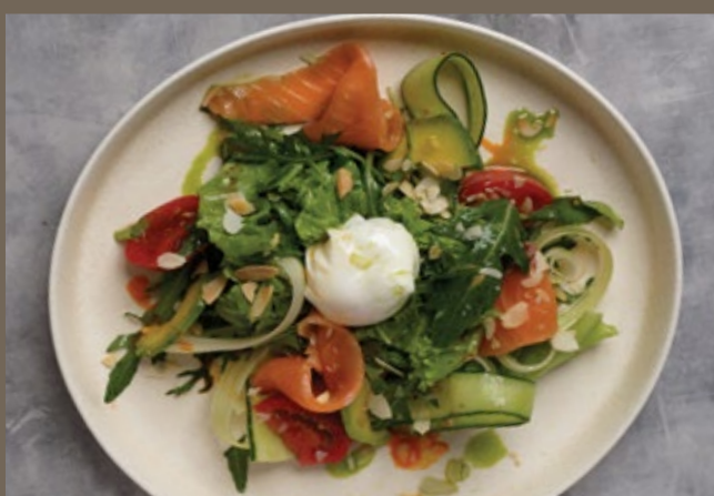
Слабосоленая сёмга, 230 гр 779 овощи, салат микс, сельдерей и яйцо-пашот

В любой салат вы можете по желанию добавить: яйцо-пашот, страчателлу, авокадо