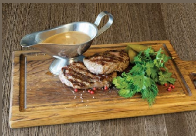
Медальоны 140/150//50 гр 1 290 из телятины, картофельное пюре, перечный соус