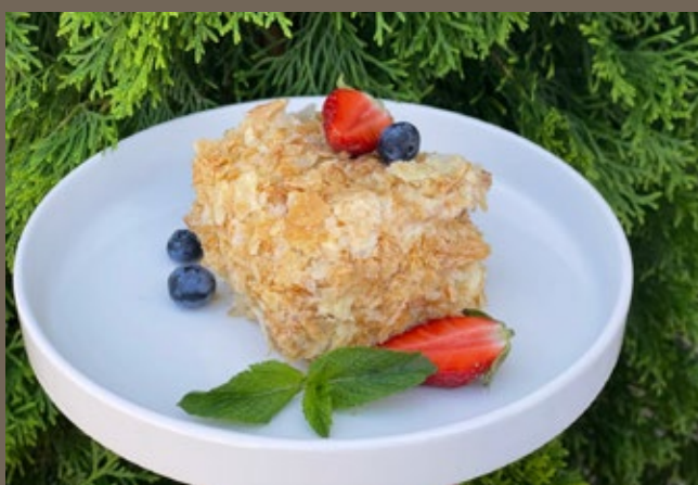
Торт Наполеон 200 гр 390