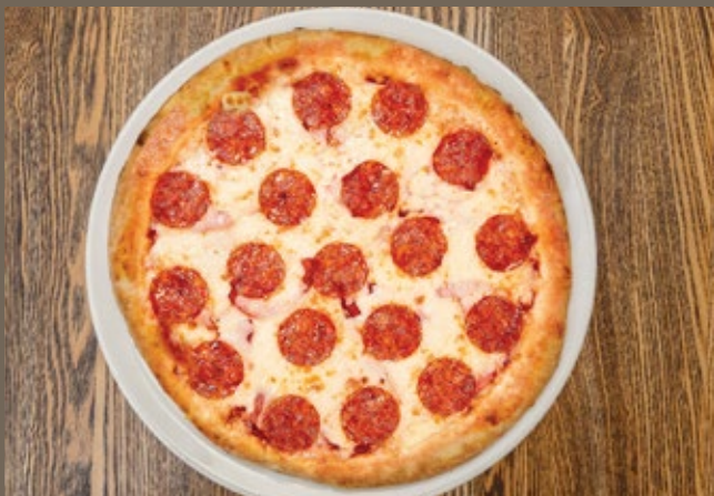
«Пепперони» 420 гр 489 Соус из помидор, колбаски Пепперони, сыр Моцарелла