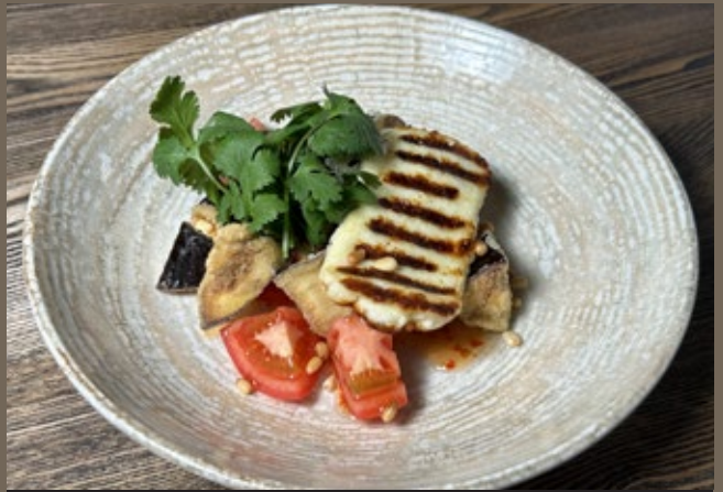
Хрустящие баклажаны, 260 гр 559 жареный Халуми, помидоры, соус Свит Чили