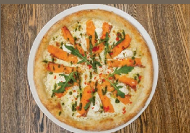
Сёмга, креветки, 450 гр 890 Моцарелла, руккола, соус белый