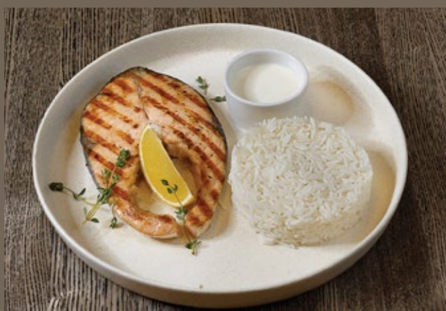
Стейк сёмги 100/150/50 гр 1 290 (гриль/на пару) рис Басмати, соус Блю-чиз