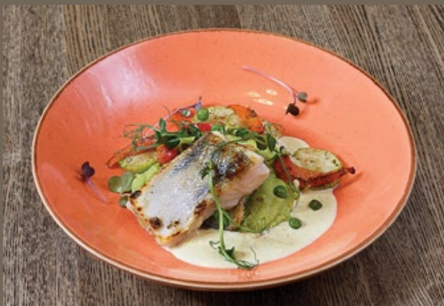
Филе судака, 270 гр 739 пюре из зелёного горошка, цукини, соус сливочный Карри