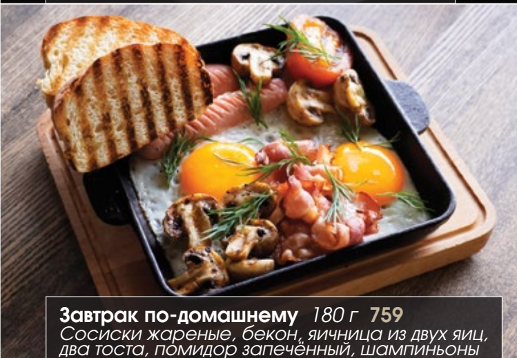
Завтрак по-домашнему 180 г 759 Сосиски жареные, бекон, яичница из двух яиц, два тоста, помидор запечённый, шампиньоны