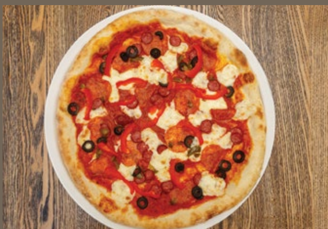
«Диабло» 470 гр 690 Соус из помидор, моцарелла, колбаски Пепперони, охотничьи колбаски, болгарский перец, перец острый, оливки