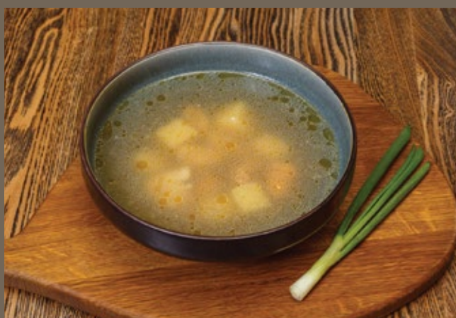
Уха из семги и судака 300 гр 549