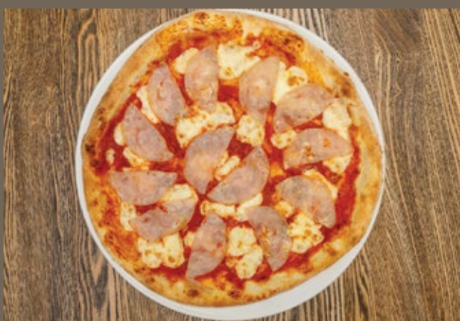
«Ветчина и сыр» 400 гр 469 Соус из помидор, Мацарелла, ветчина