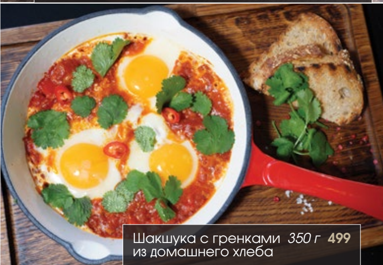
Шакшука с гренками 350 г 499 из домашнего хлеба