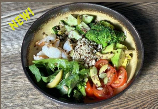
Креветки, киноа, 260 гр 649 брокколи, авокадо, огурец, помидоры черри, микс злаков