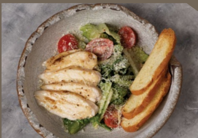
Цезарь с курицей 220 гр 559