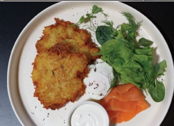
Картофельные драники, 230 г 499 сёмга, сметана, яйцо пашот