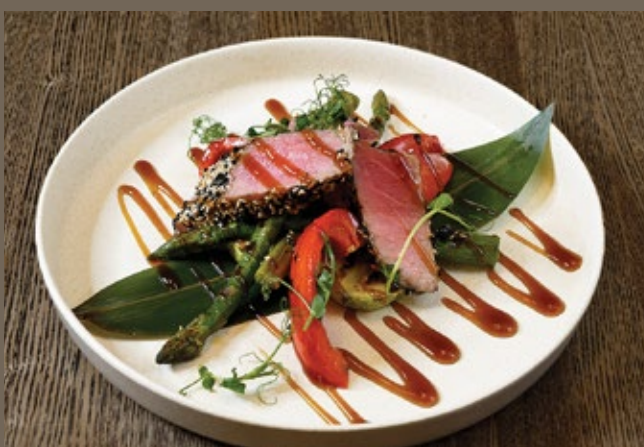
Тунец в кунжуте, 250 гр 859 овощи-гриль, соус Терияки