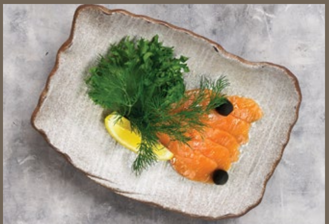
Сёмга слабосоленая 80/30 гр 690 с лимоном