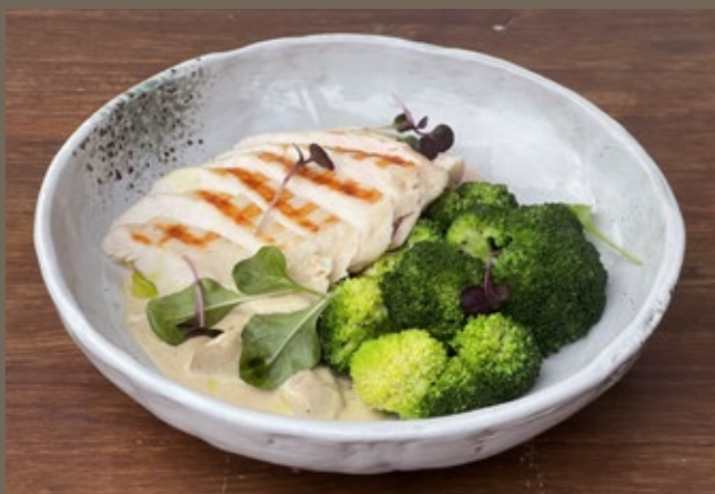
Куриная грудка сувид, 300 гр 569 брокколи, сливочно-грибной соус