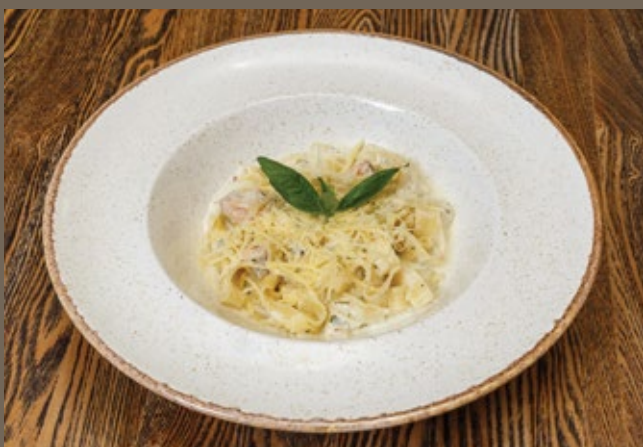
Фетучини с сёмгой 270 гр 590 и сливочным соусом