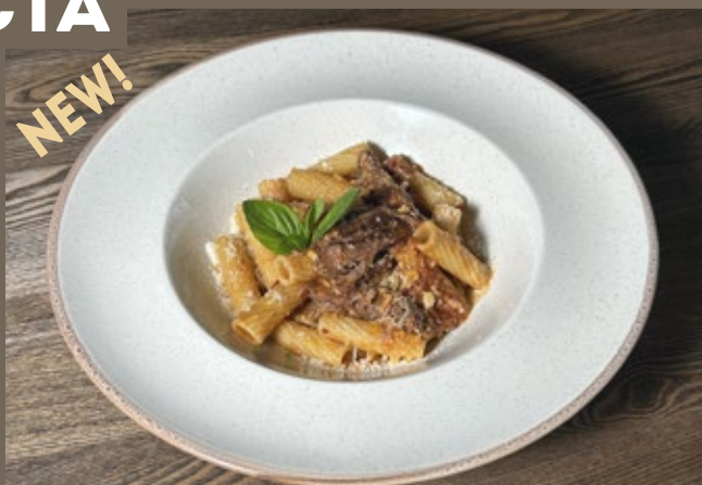
Тортильони, 340 гр 679 томлёная говядина, соус Аррабьята, Пармезан