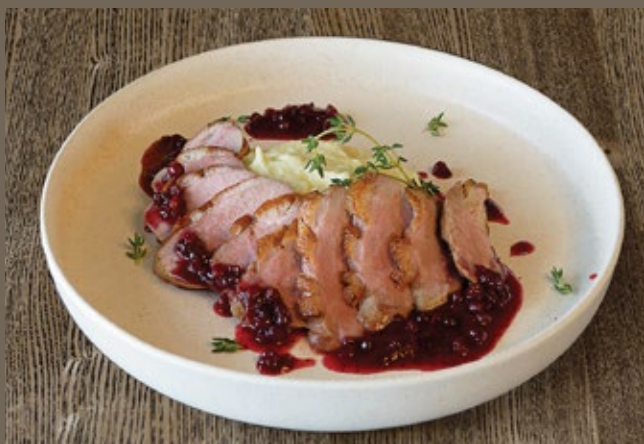
Утиная грудка, 380 гр 729 картофельное пюре, брусничный соус