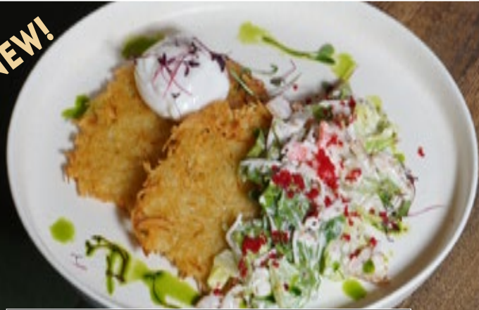
Картофельные драники 260 г 699 с камчатским крабом и креветками