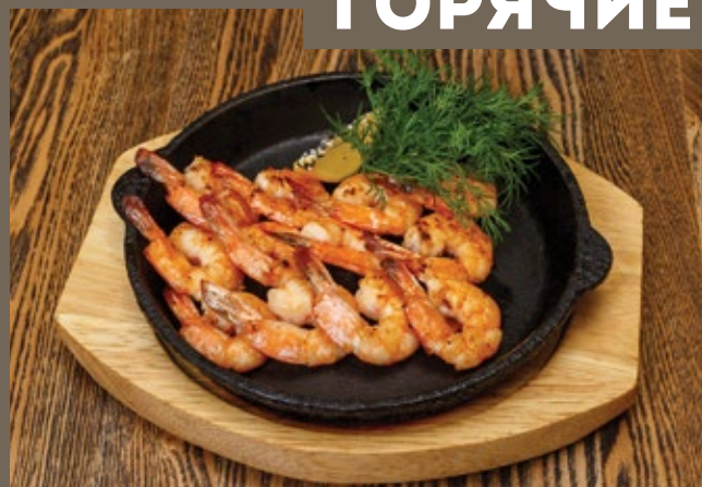
Тигровые креветки, 150/20 гр 879 жареные с чесноком и зеленью