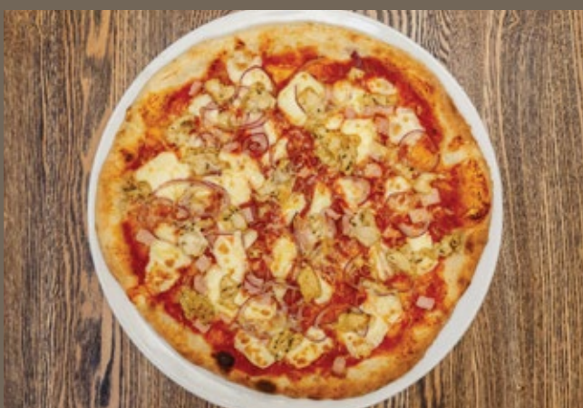
Пицца «Поло» 520 гр 639 Соус из помидор, Моцарелла, Пармезан, куриное филе, карбонад, лук розовый