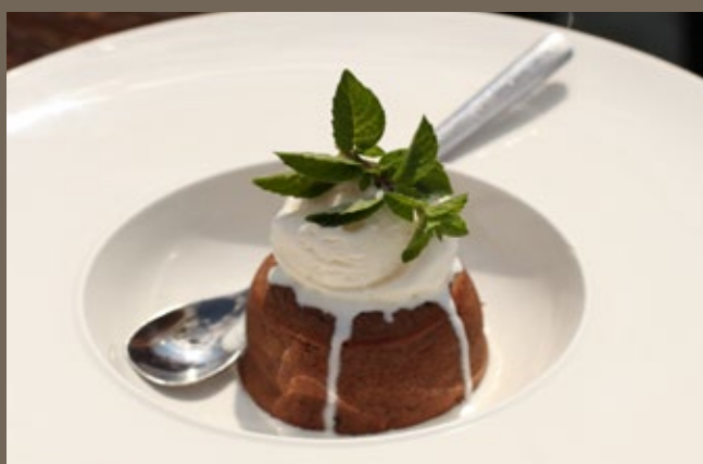
Шоколадный фондан 100/50 гр 429 с шариком мороженого