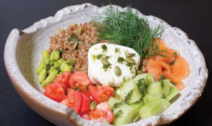
Греча боул с сёмгой, 330 г 539 свежими овощами и яйцом пашот