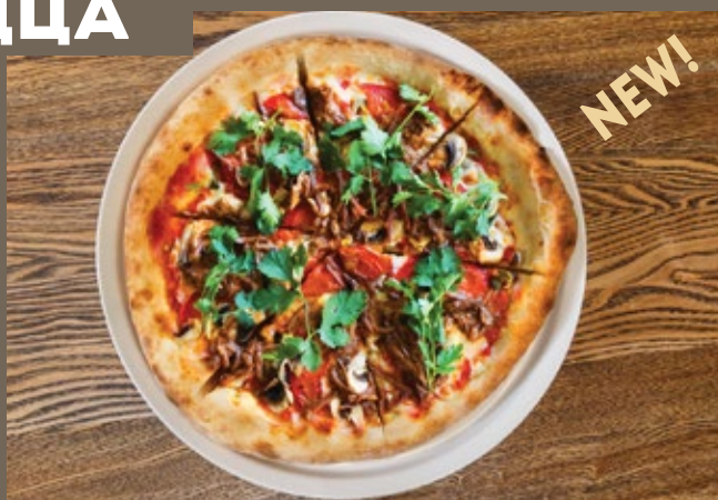
С томлёной говядиной 470 гр 790 и Моцареллой Соус из помидор, Моцарелла, томлёная говядина, каперсы, томаты, шампиньоны, кинза, Перец халапеньо