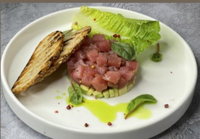
Тар-тар из сёмги 160 гр 729 или тунца