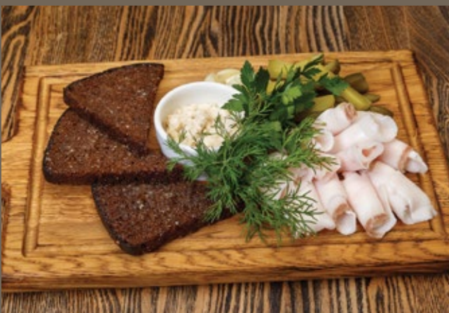
Сало, хрустящие гренки, соленый огурец 170/50 гр 499