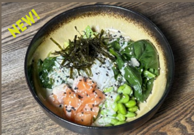
Семга, рис, 240 гр 629 авокадо, бобы Эдамаме, Чука, шпинат, соус ореховый