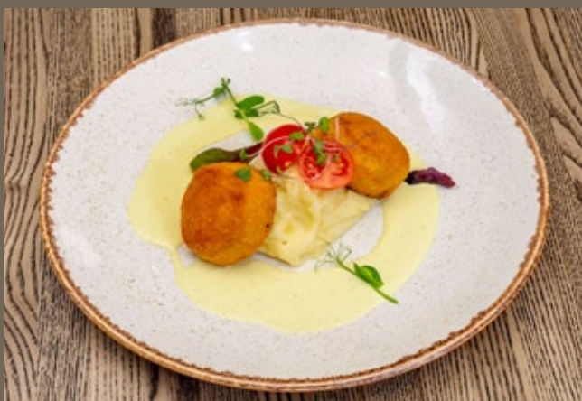
Биточки куриные, 340 гр 559 картофельное пюре, соус сливочный Карри