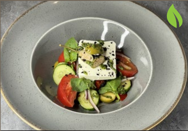
Салат в греческом стиле 280 гр 529