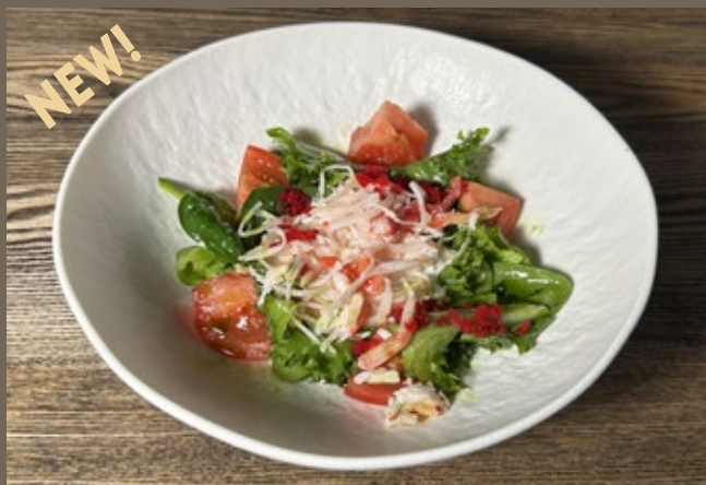
Камчатский краб, 200 гр 829 Страчателла, томаты, шпинат