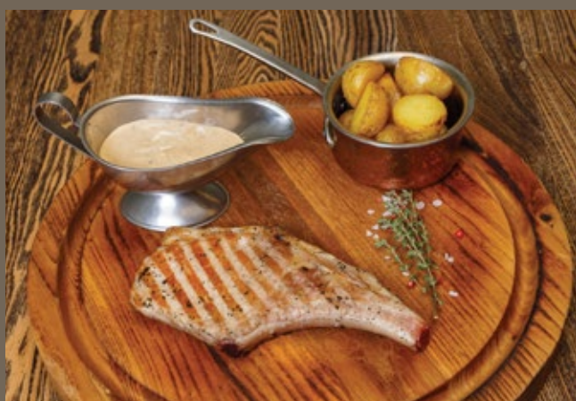
Стейк из свинины 180/150/50 гр 690 на косточке, печёный картофель бейби, перечный соус