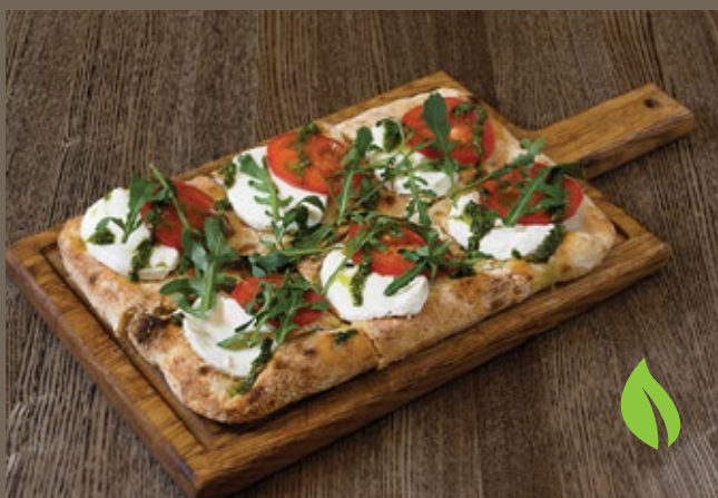
С моцареллой, 365 гр 429 помидорами и соусом песто