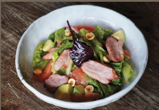
Утиная грудка, грейпфрут, 230 гр 690 авокадо, жареный фундук