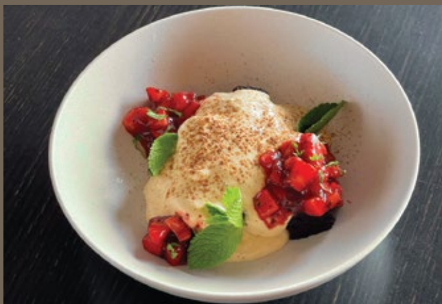
Сметанник 270 гр 429 с черникой