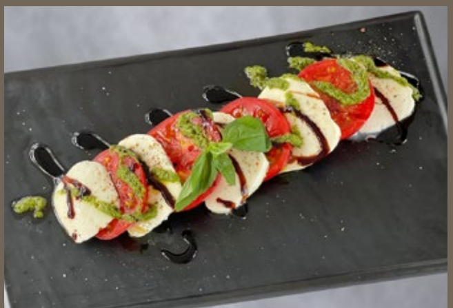
Капрезе 250 гр 659 Помидоры, моцарелла, базилик, соус Песто