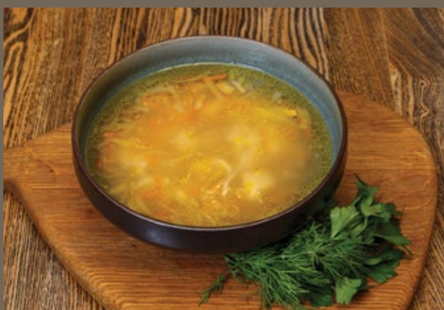
Суп куриный с домашней 300 гр 529 лапшой и белыми грибами