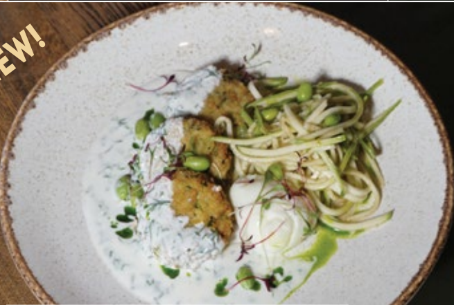
Оладьи из цукини 300 г 459 с курицей, соусом Маццони