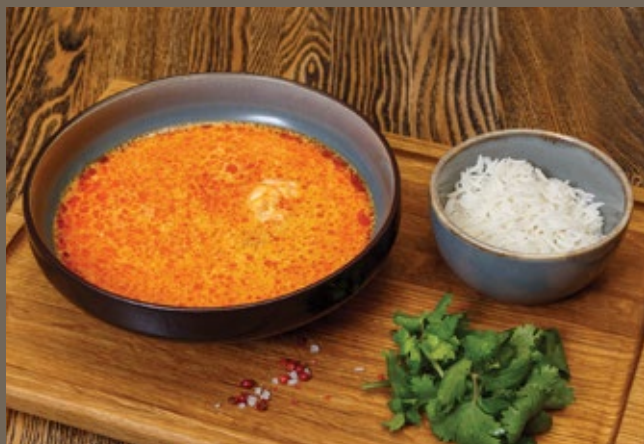
Суп Том Ям 300/70 гр 590 с креветками и курицей