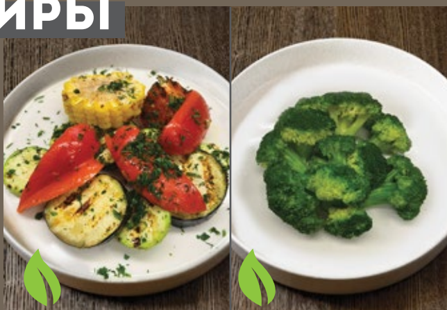
Овощи-гриль 250 гр 339 Брокколи на пару 150 гр 329