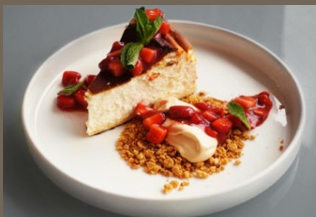
Чизкейк Сан Себастьян 200 гр 429