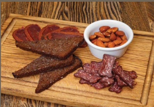
Закуска к пиву 160 гр 539 Бастурма, суджук, жареный миндаль, чесночные гренки