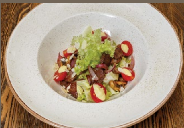
Теплый салат с телятиной 220 гр 749 и овощами в Паназиатском стиле