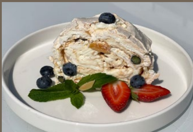
Меренговый рулет 160 гр 529