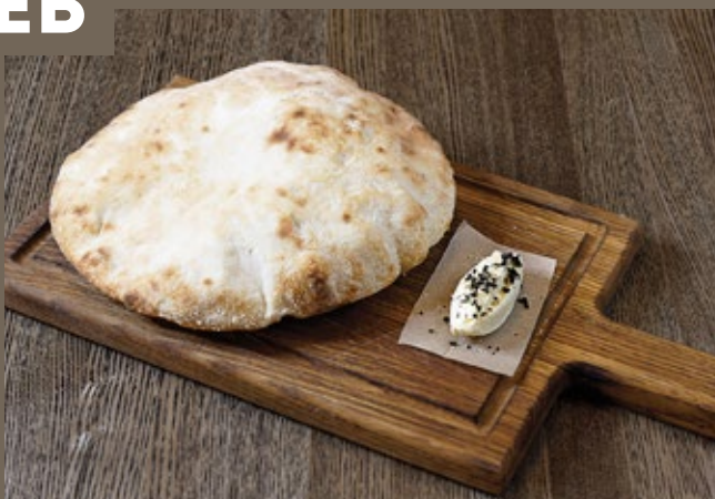
Пита из печи 180/30 гр 259 с копченым маслом