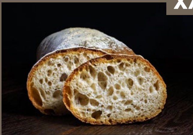
Чиабатта 50 гр 99