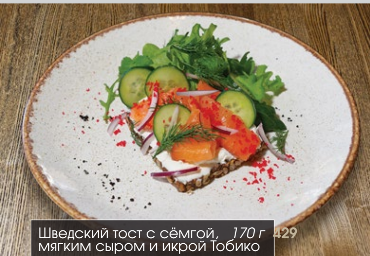
Шведский тост с сёмгой, 170 г 429 мягким сыром и икрой Тобико

*Любую кашу мы можем приготовить для Вас на кокосовом, миндальном, соевом молоке