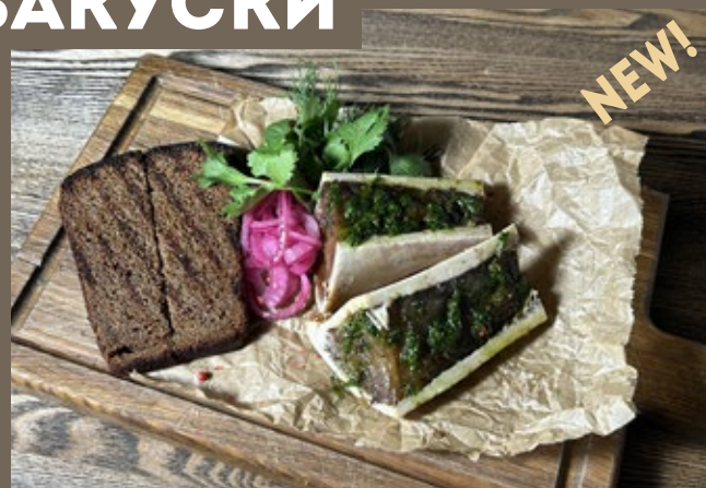
Мозговые кости, 200/50 гр 499 бородинский хлеб, соус Чимичурри