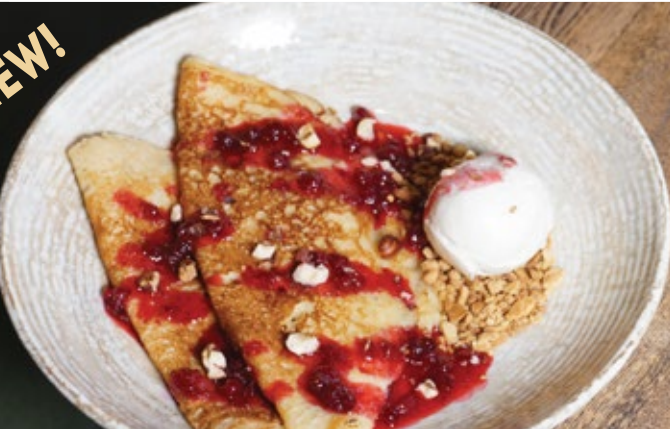
Яблочные блины на опаре 270 г 429 с шариком мороженого, брусничным соусом и жареным фундуком