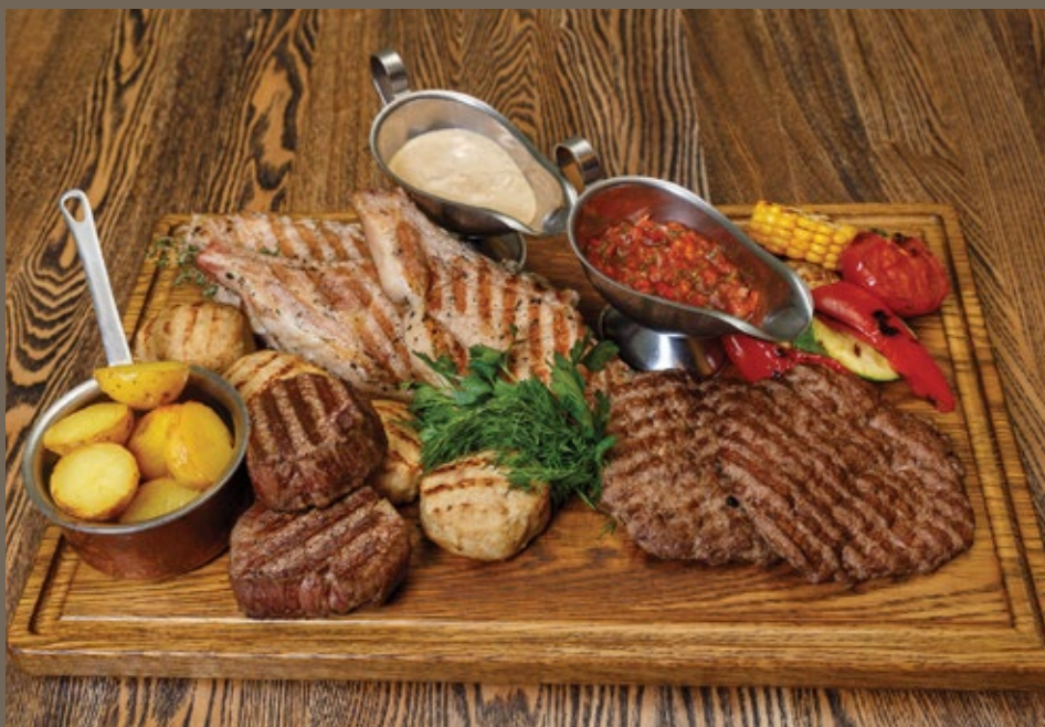
Мясная доска «Гранд Роял»