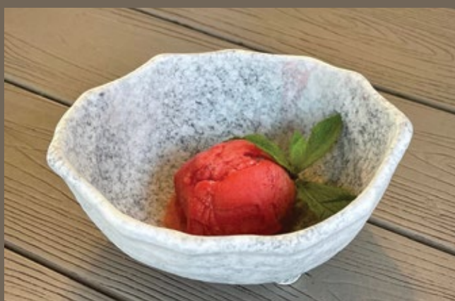
Пломбир 150/50 гр 329 с соусом из сезонных ягод Сорбет малина-манго 50 гр 199