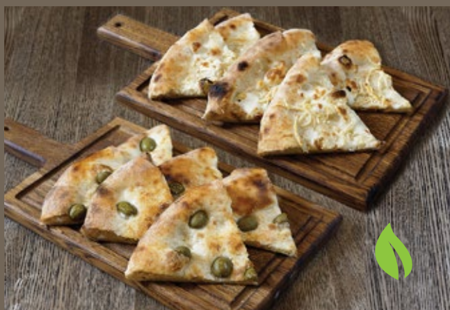
С розмарином 180 гр 259 С сыром 220 гр 279