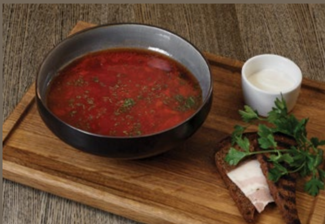
Борщ с говядиной 300/40 гр 529 и салом с гренками