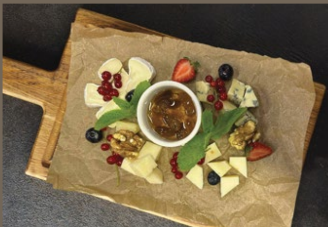
Сыры: 120/80 гр 959 Монтеблун, Камамбер, Пекорино, Качотта с трюфелем