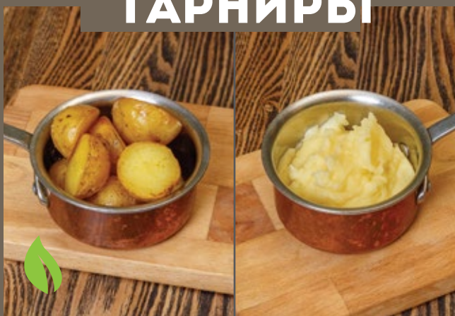
Картофель запеченный 150 гр 199