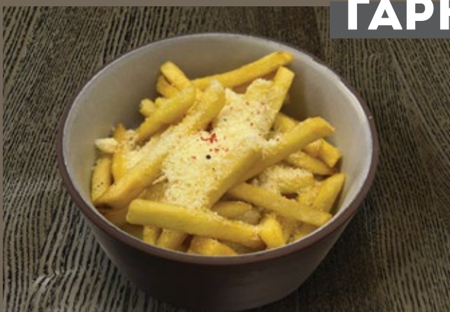
Картофель фри, 180 гр 329 Пармезан, трюфельное масло