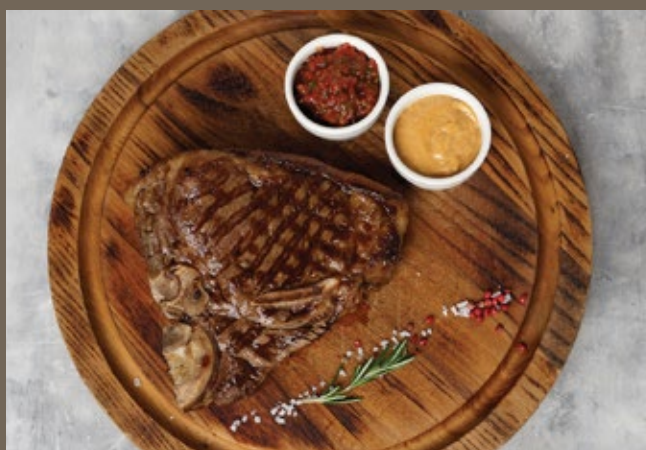
Нью-Йорк (стриплойн) за 100 гр 739