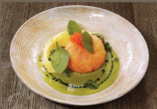
Краб кейк, 320 гр 659 картофельное пюре, соус из шпината