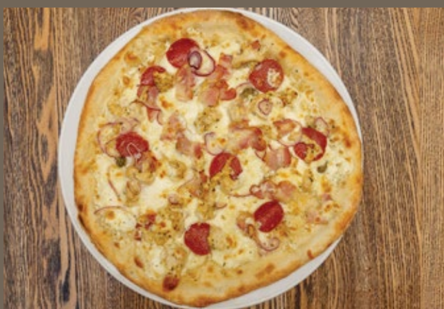
Пицца «Верона Белла» 470 гр 729 Соус белый, курица, бекон, салями, каперсы, Пармезан, лук розовый