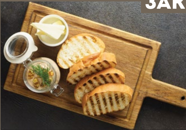
Паштет из печени 100/100/30 гр 499 кролика инжиром, хрустящий багет