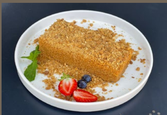
Торт Медовый 160 гр 390