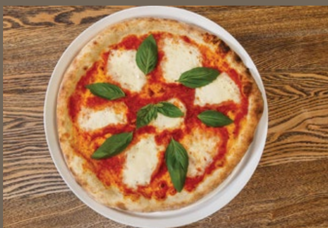
«Маргарита» 350 гр 490 Соус из помидор, Мацарелла в рассоле, свежий базилик