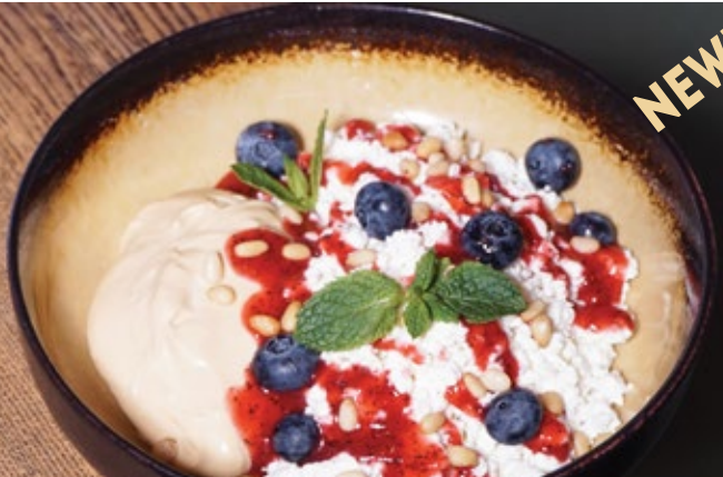
Дермерский творог, 250 г 429 свежая ягода, крем из топленого молока