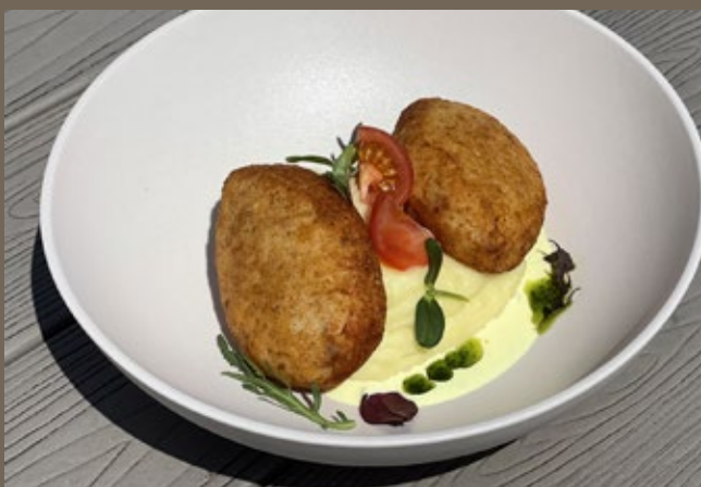
Котлеты из щуки, 340 гр 559 картофельное пюре, сливочный соус