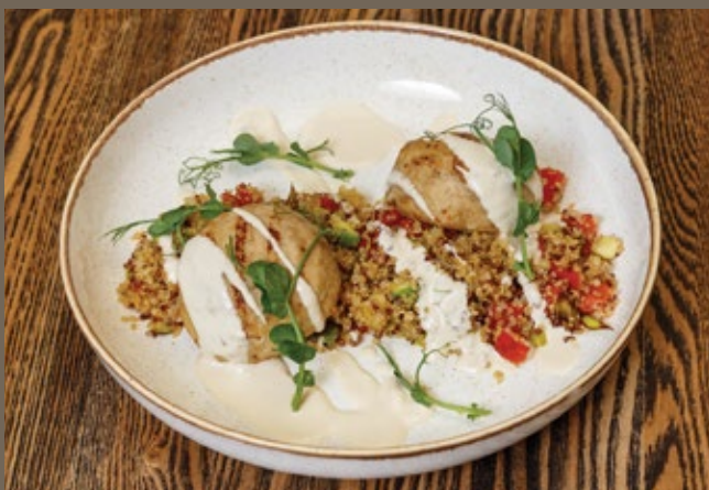
Котлеты из индейки, 300 гр 569 киноа с овощами, сливочный соус