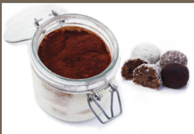
Тирамису 150 гр 359 Конфеты ручной работы за 1 шт 139