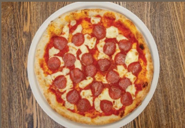
«Сальсичча» 430 гр 490 Соус из помидор, моцарелла, салями, свежий базилик