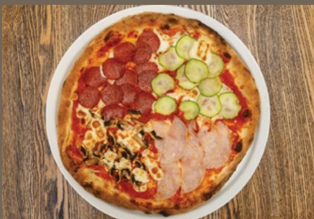
«Четыре сезона» 440 гр 549 Соус из помидор, Моцарелла, ветчина, салями, шампиньоны, цукини