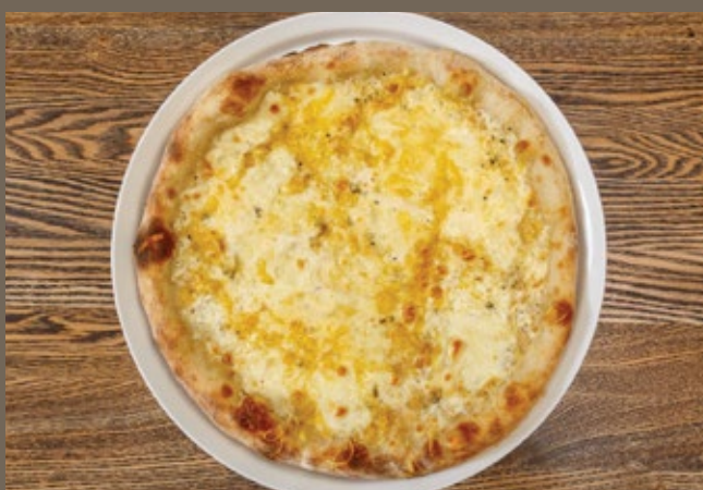
Четыре сыра с трюфелем 500 гр 789 Соус белый, Монтеблун, Мацарелла, Пармезан, Качотта с трюфелем