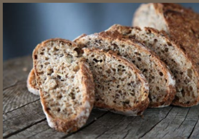
Хлеб цельнозерновой 60 гр 129