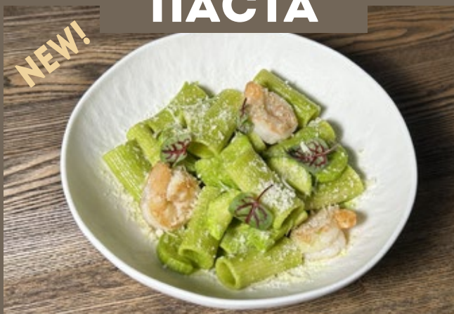
Ригатони, тигровые креветки, 360 гр 690 цукини, шпинатный соус