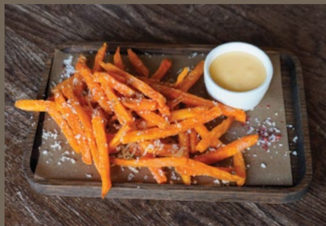
Батат фри, соус Айоли 200 гр 459