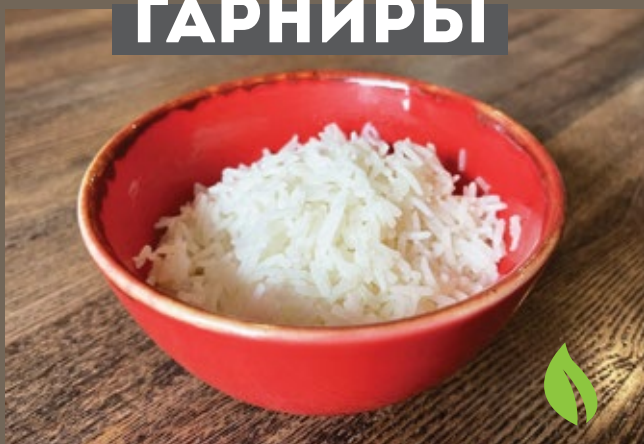
Рис Басмати 150 гр 179